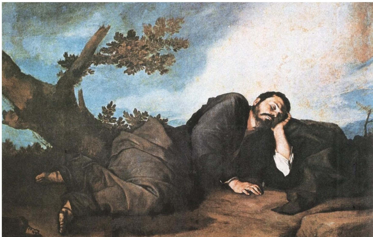
José de Ribera: Jákób álma

----- BÉKÉS, BOLDOLG ÚJ ÉVET KÍVÁNUNK MINDEN KEDVES OLVASÓNKNAK